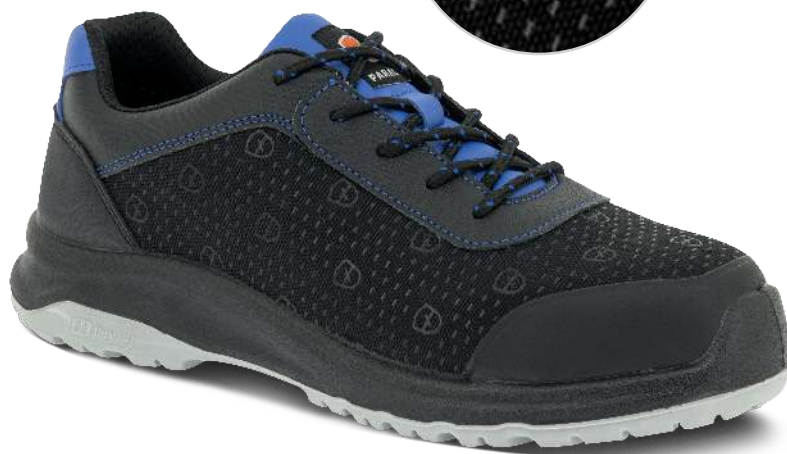
8832 BLEU | 35 ▶ 48