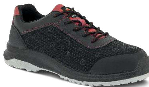
8836 ROUGE | 35 ▶ 48